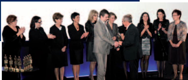
Wsparcie kontraktów Zespół CUK