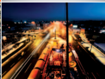
Odazotownia w Grodzisku Wlkp.